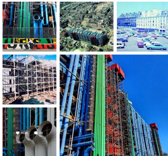
Figure. 11 : Echantillon de photographies ayant pour sujet l'architecture iconique du centre Pompidou sur le compte officiel Instagram.

Ce marqueur fort qu'est l'architecture est complété dans l'univers de marque par un ensemble de photos publiées au cours du confinement qui rappelle la genèse et la construction de l'enveloppe architecturale particulièrement décrite au moment de sa création. Le panel suivant l'illustre bien (fig.11).