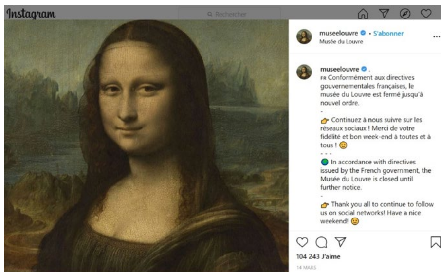
Figure. 4 : Capture d'écran du communiqué officiel de fermeture du Louvre sur le compte Instagram du musée lors du premier confinement le 14.03.2020

Cet « attribut identitaire » (collection), ce référent culturel à la notoriété universelle est exploité par le Louvre sur son compte Instagram de façon récurrente pour être le marqueur fort de la marque. Le musée met en avant un avatar, un portrait culte connu de tous et qui est reconnue donc par le public jeune, majoritaire sur Instagram. La Joconde est l'avatar de la communication du Louvre sur Instagram. Cette démarche est poussée au point que la communication institutionnelle sur Instagram est portée par l'image de la Joconde, comme en témoigne le communiqué officiel de fermeture du Louvre pendant le confinement lié au COVID (fig.4).