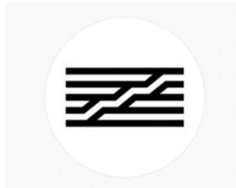
Figure. 10 : Avatar du compte Instagram officiel du Centre Pompidou.

Ce marqueur fort qu'est l'architecture est complété dans l'univers de marque par un ensemble de photos publiées au cours du confinement qui rappelle la genèse et la construction de l'enveloppe architecturale particulièrement décrite au moment de sa création. Le panel suivant l'illustre bien (fig.11).