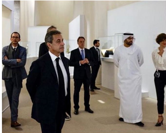
Figure. 9 : Visite de Nicolas Sarkozy au LAD le 05 Mars 2020, médiatisée sur le compte Instagram officiel du LAD.