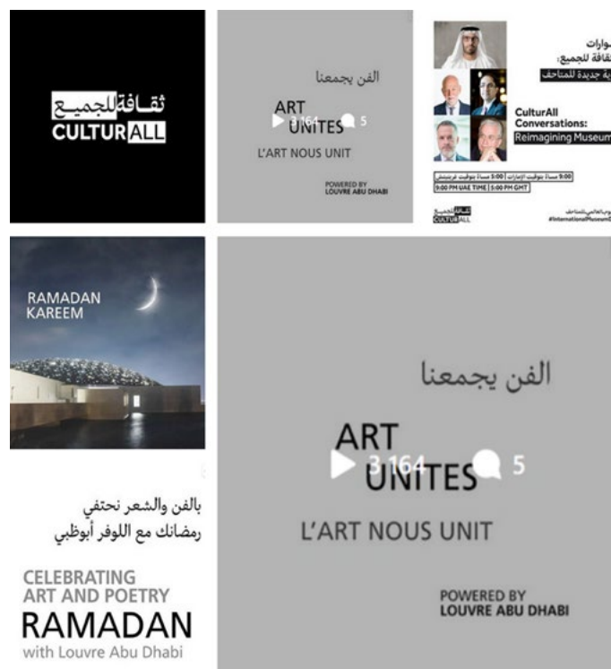
Figure. 8 : Echantillon de photos portant sur l'interculturalité et le dialogue des civilisations