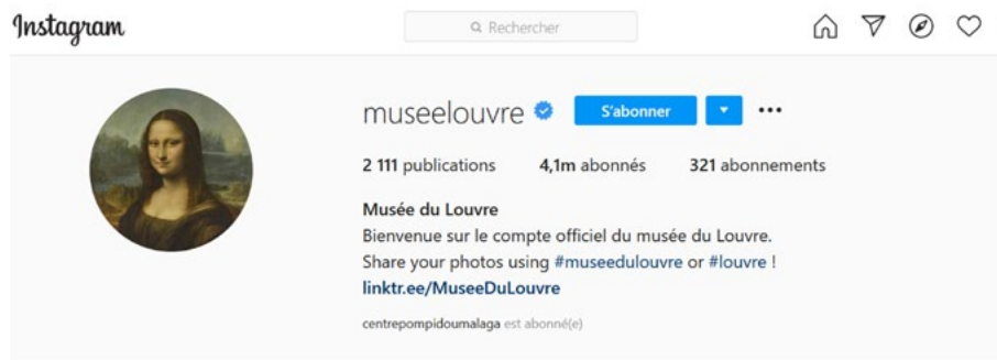
Figure. 3 : Capture d'écran du compte officiel Instagram du Louvre.

Le logo utilisé pour son compte Instagram est en revanche une icône, une figure universelle qui, seule, attire des millions de visiteurs chaque année : La Joconde (fig.3).