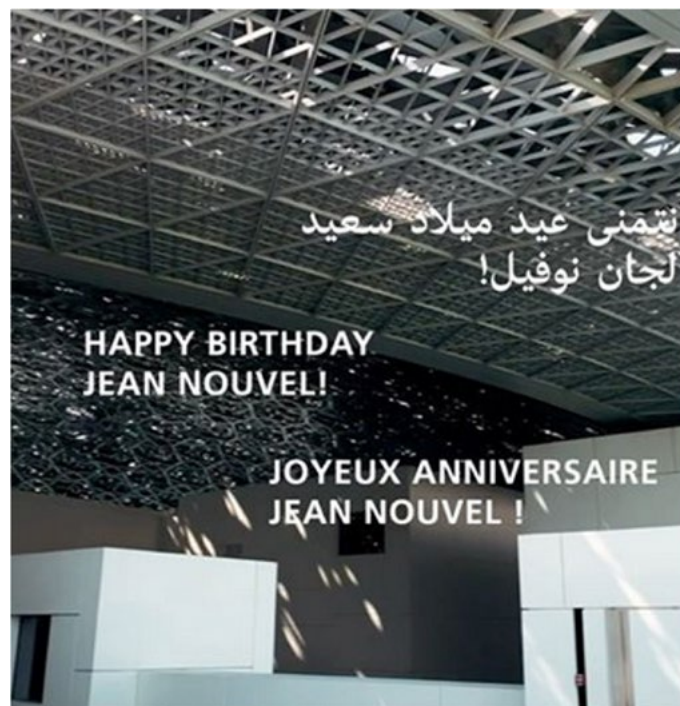
Figure. 7 : Publication relative à Jean Nouvel sur le compte officiel du LAD.

L'accent porté sur le bâtiment va jusqu'à souhaiter (en arabe, en anglais et en français) un « joyeux anniversaire » à l'architecte français Jean Nouvel qui a réalisé l'enveloppe et donc la signature architecturale du LAD (fig.7).