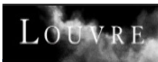
Figure. 2 : Le logo institutionnel du Louvre. Source : https://www.louvre.fr/

De son côté, le Louvre dissocie ses logos entre son site web et son compte Instagram. Pour le site Web, le logo (fig.2) est institutionnel et il se décline sur l'ensemble des documents publiés par le musée.