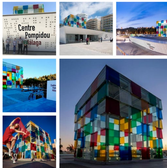
Figure. 14 : Echantillon de photos ayant pour sujet El Cubo sur le compte Instagram officiel du CPM.

En parallèle et de façon analogue aux autres institutions de notre corpus, le CPM utilise l'architecture comme un référent important de sa marque. Il est mis en avant El Cubo (fig.14), le cube transparent sur lequel Daniel Buren est intervenu à la demande du Centre dans le cadre de l'aménagement du CPM (voir supra). Il est régulièrement publié sur le compte Instagram comme un marqueur du musée.