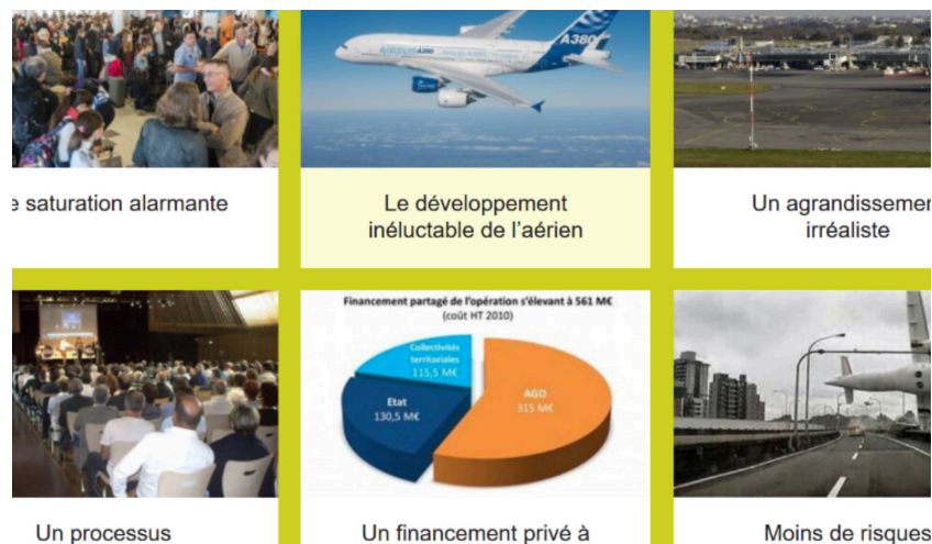
Figure 1 : présentation des rubriques de l'onglet « Les données pour comprendre », page d'accueil site Des ailes pour l'ouest

Cependant, le site de l'association « Des ailes pour l'ouest » privilégie un vocabulaire moins technocratique. Ainsi, une des rubriques consacrées à l'environnement annonce clairement : « Un nouvel aéroport plus «vert» ». Alors que le site du SMA titre avec moins d'emphase : « Une biodiversité préservée ». Le ton du site « Des ailes pour l'ouest » se veut donc direct et familier, à la limite parfois du slogan : « Sauver Saint-Aignan de Grand-Lieu ». La dramatisation n'est pas non plus absente : « Résister aux menaces et à la violence », « Une saturation alarmante ». Elle se retrouve aussi dans certaines illustrations visuelles qui accompagnent la présentation des rubriques en « patchwork de tuiles » (Lachaud, 2016) sur la page d'accueil (cf. figure 1). C'est ainsi que les internautes peuvent voir la rubrique « Moins de risques » agrémentée de l'image d'un avion en détresse au-dessus d'une voirie urbaine. Le site de l'association « Des ailes pour l'ouest » semble aussi s'inscrire dans une volonté de polémique argumentaire. Ainsi, dans la rubrique « Résister aux menaces et à la violence », les opposants à l'AGO, (occupants illégaux de la Zad, élus écologistes ou militants associatifs...) sont identifiés et désignés nommément, parfois photos à l'appui.