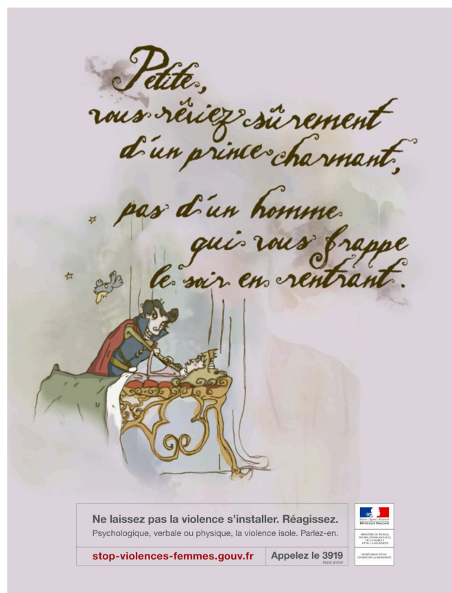
Image 1. Affiche campagne 2008 « Ne laissez pas la violence s'installer. Réagissez »

La communication publique française victimise les femmes subissant des violences au sein de leur couple. Cela est observable dans les différents supports des campagnes (affiches, spot télévision et site internet) où la femme est représentée comme une personne incapable de se défendre, de fuir, ou d'appeler à l'aide. Ce manque de réaction des victimes a été mis en avant dans l'étape de publicisation du problème réalisée par les féministes.