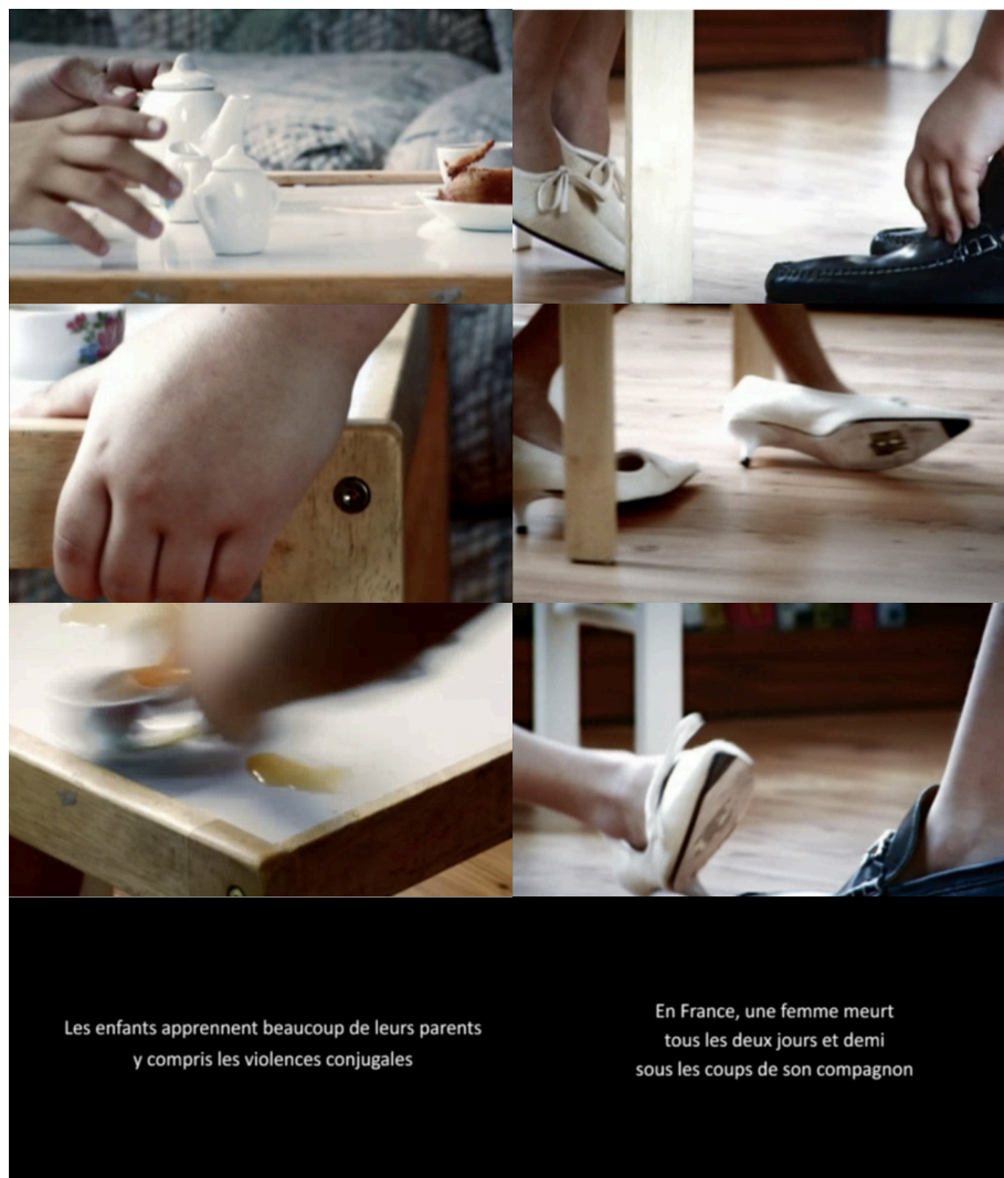
Image 2. Prises d'écran du spot télévisé diffusé en 2010 et 2011, « Les enfants apprennent beaucoup de leurs parents y compris les violences conjugales »

Dans le spot télévisé de la campagne de novembre 2010 et 2011 (Image 2), la Dicom a mis en scène l'acte de la violence. Deux enfants jouent à la dinette, la petite fille qui représente la femme victime renverse un peu de thé sur la table, ce qui provoque la colère du garçon, qui représente l'homme agresseur. Bien que la fille essaye de le calmer, il finit par l'agresser.