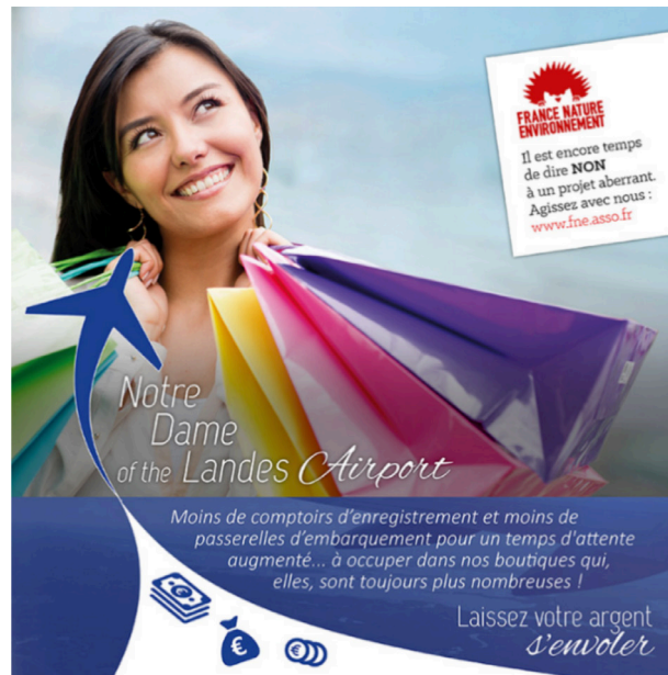
Figure 3 : visuel « campagne publicitaire » conçu pour la consultation locale, site France Nature Environnement

s'opposer au scénario catastrophe décrit par les mots et illustré par l'image : « Il est encore temps de dire NON à un projet aberrant. Agissez avec nous ».