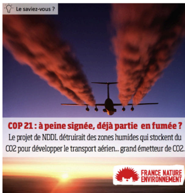
Figure 2 : visuel « Le saviez-vous ? » conçu pour la consultation locale, site France Nature Environnement

Sur ces dix-sept éléments visuels, onze sont placés sous l'égide d'une accroche : « Le saviez-vous ? » (cf. figure 2). Les destinataires et destinatrices se voient ainsi présenter un argument chiffré contre les conséquences du projet de NDL (« Un aéroport à NDDL détruirait + de 700 ha de zones humides qui atténuent les effets des sécheresses ou des inondations ») ou à une assertion contre les errements de la procédure (« L'inventaire des espèces présentes à Notre-Dame-des-Landes a été rédigé un mois avant d'être réalisé sur le terrain »).